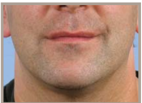
VOR DER THERMAGE-BEHANDLUNG 9 MONATE NACH DER BEHANDLUNG