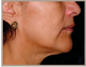
VOR DER THERMAGE-BEHANDLUNG 1 MONAT NACH DER BEHANDLUNG