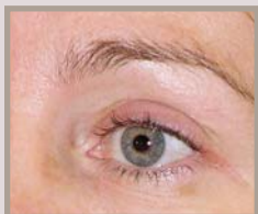
VOR DER THERMAGE-BEHANDLUNG 2 MONATE NACH DER BEHANDLUNG