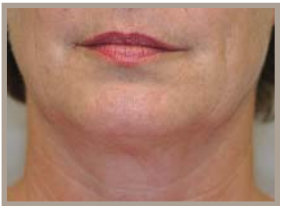
VOR DER THERMAGE-BEHANDLUNG 2 MONATE NACH DER BEHANDLUNG