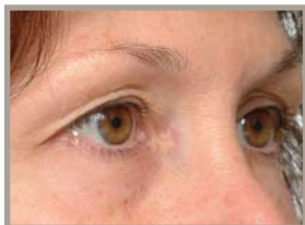
VOR DER THERMAGE-BEHANDLUNG