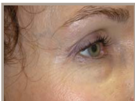
15 MONATE NACH DER BEHANDLUNG