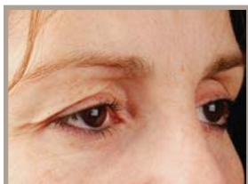
VOR DER THERMAGE-BEHANDLUNG