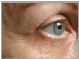
VOR DER THERMAGE-BEHANDLUNG 6 MONATE NACH DER BEHANDLUNG

Alle Vorher- und Nachher-Fotos sind nicht retuschiert und zeigen Patientinnen, bei denen beträchtliche Erfolge erzielt wurden. Die Ergebnisse können unterschiedlich sein.