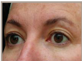
VOR DER THERMAGE-BEHANDLUNG 4 MONATE NACH DER BEHANDLUNG