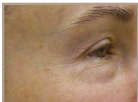
VOR DER THERMAGE-BEHANDLUNG