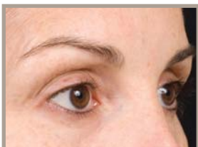
15 MONATE NACH DER BEHANDLUNG