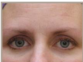
VOR DER THERMAGE-BEHANDLUNG 7 MONATE NACH DER BEHANDLUNG