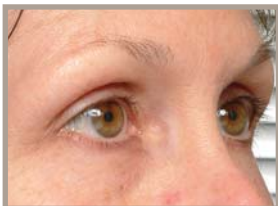
6 MONATE NACH DER BEHANDLUNG