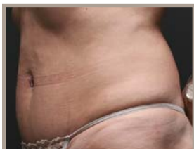
VOR DER THERMAGE-BEHANDLUNG 6 MONATE NACH DER BEHANDLUNG