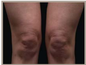
VOR DER THERMAGE-BEHANDLUNG 2 MONATE NACH DER BEHANDLUNG