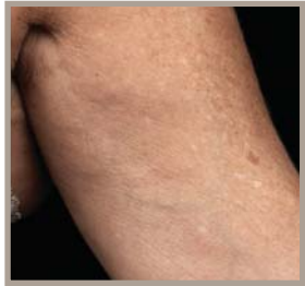
VOR DER THERMAGE-BEHANDLUNG 2 MONATE NACH DER BEHANDLUNG