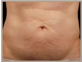
VOR DER THERMAGE-BEHANDLUNG 6 MONATE NACH DER BEHANDLUNG